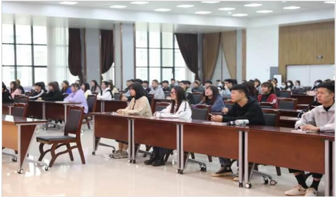
学生们听讲座现场