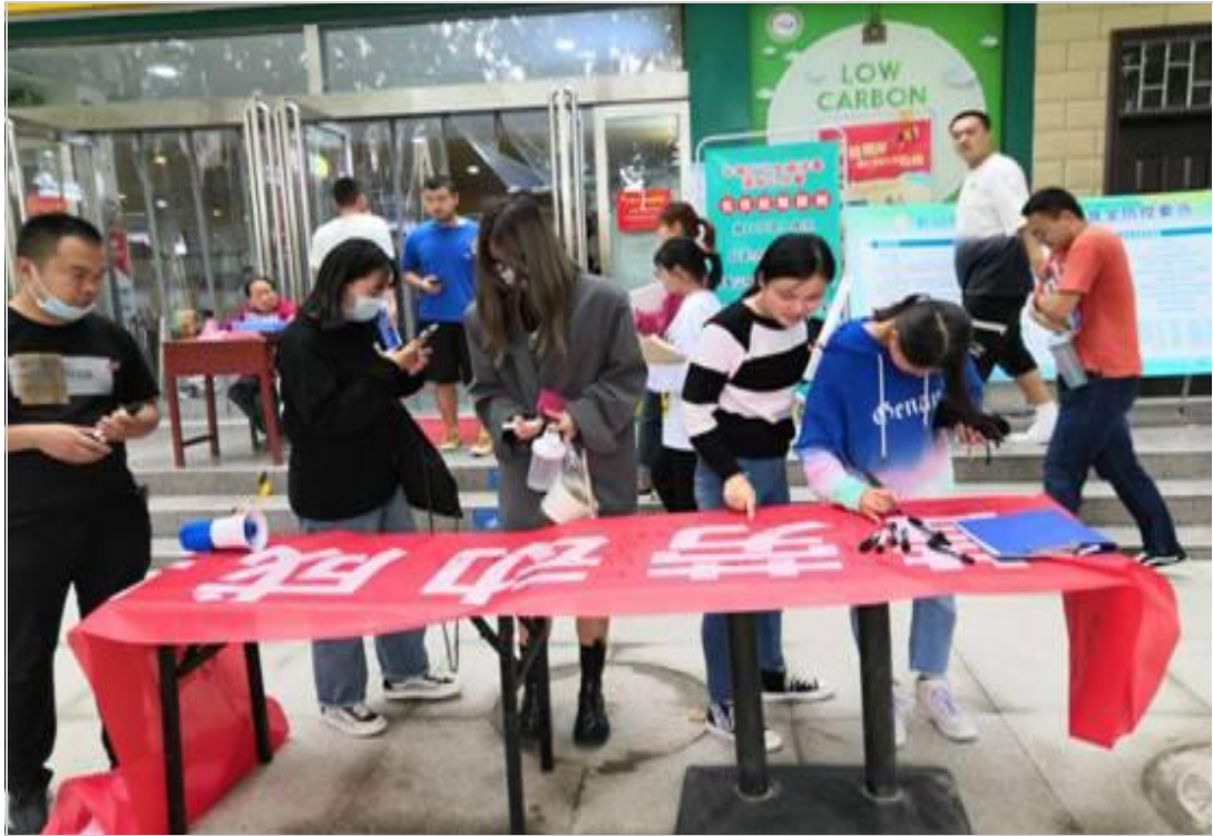
学生食堂开展“节约粮食、爱惜劳动成果”的签字活动