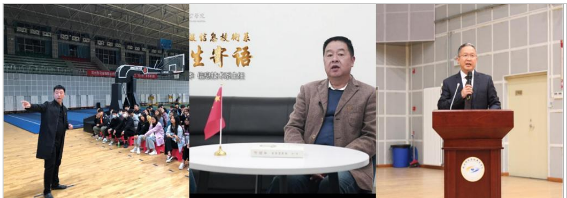
各院系负责人开展入学教育