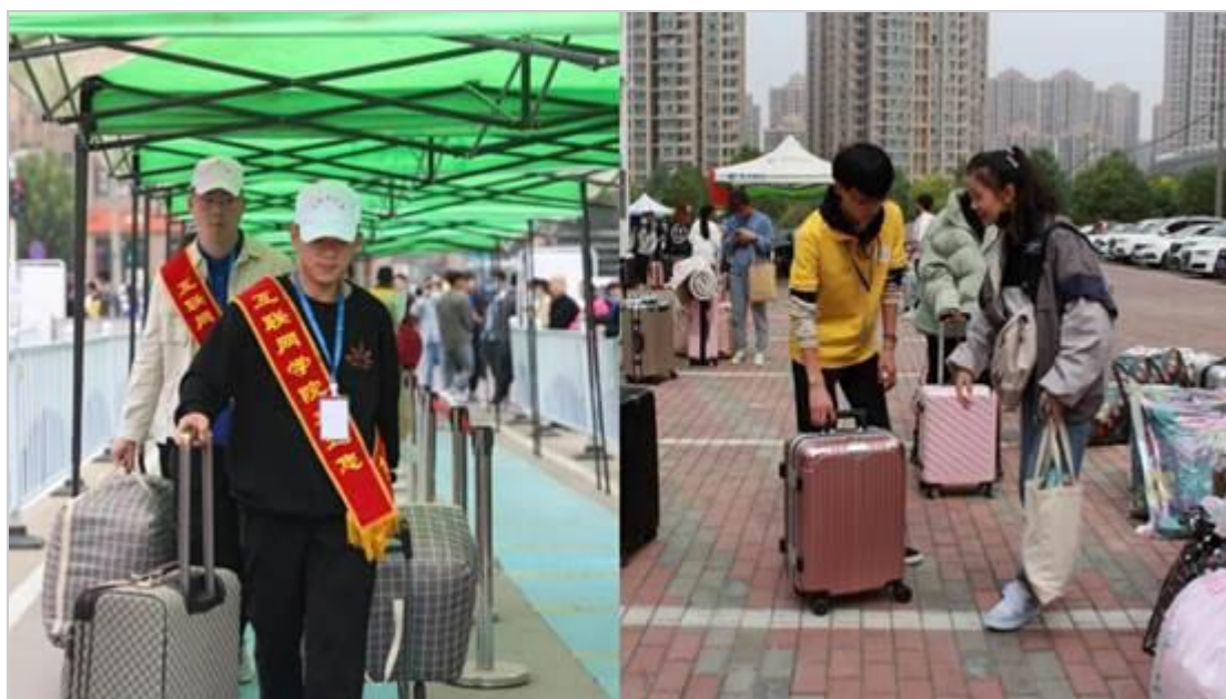
志愿者们帮新生搬行李

他们穿梭于校园的各个角落，教学楼、宿舍楼，扛包裹、拎箱子，不言辛劳，满脸笑容，热闹而温馨。