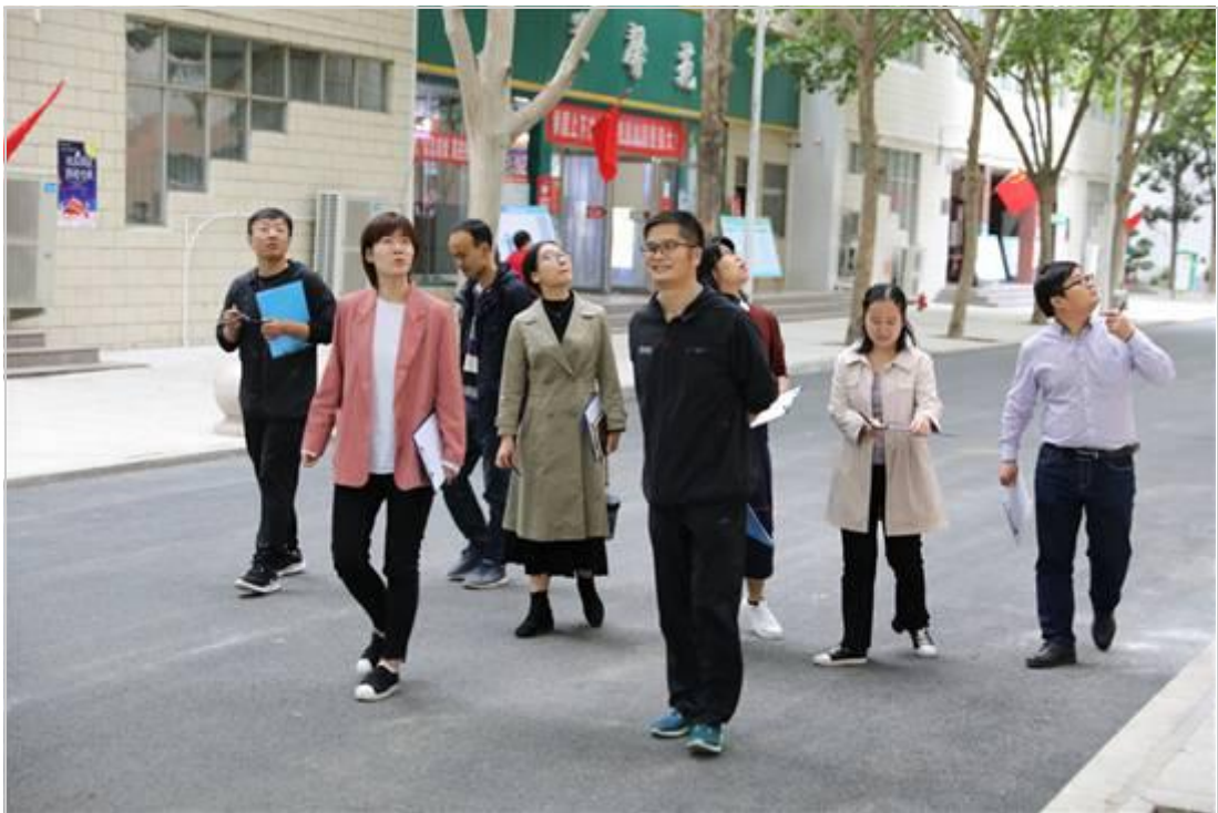
职工代表巡视校园