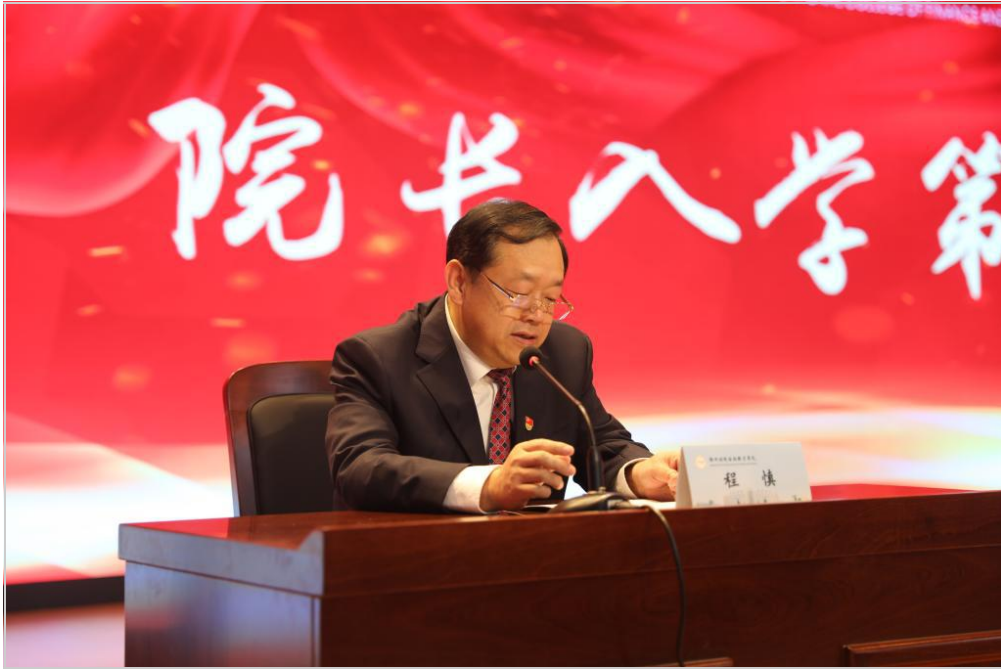
程慎院长为新生亲授“入学第一课”