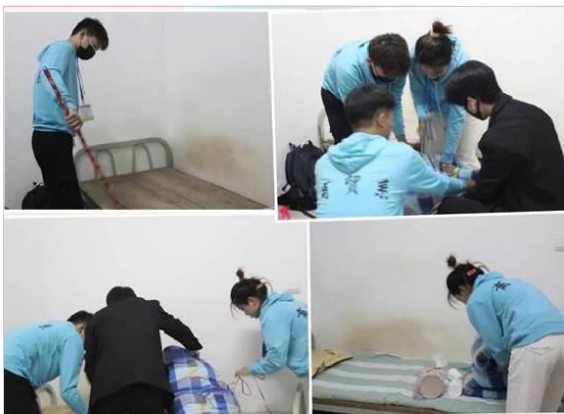
志愿者们帮助新生打扫宿舍