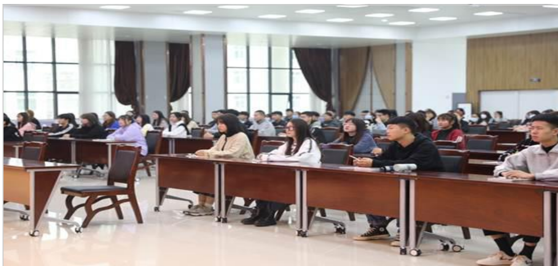
【审核：陈 勇】

听清风细雨、莫负好芳华。别样的入学“第一课”，将新生入学教育与爱国励志、知校爱校荣校精神培养以及良好行为养成有机结合，把无形的思想政治教育工作融入有形的校园文化中，帮助入学新生尽快适应大学生活，让广大新生在讲座中接受大学文化熏陶，开阔视野，启迪智慧，陶冶情操，激发大胆创新、勇于拼搏的青春斗志，感受丰富多彩的校园文化生活，同时为日后的学习生活指明方向，在新的起点上孜孜以求，努力奋斗，让未来大学三年的学习生活学有所成。