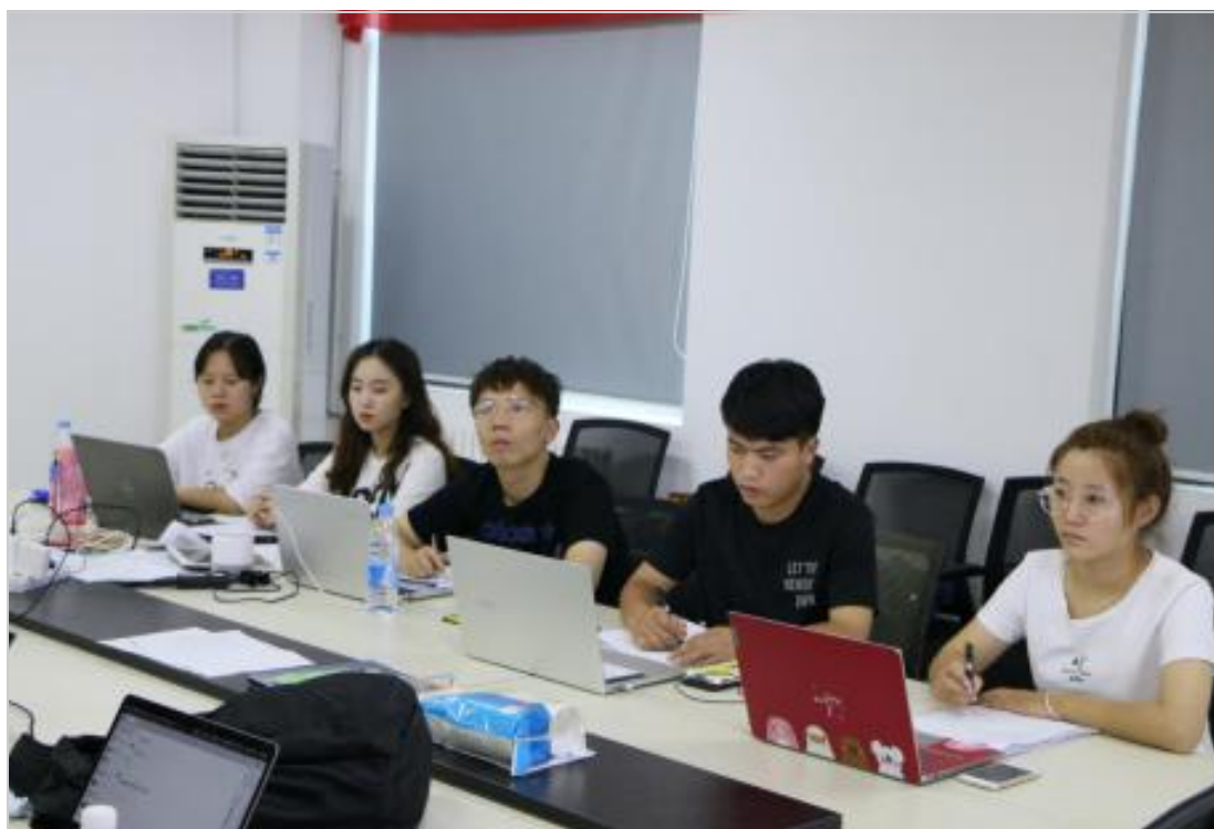
“云盾”创业团队集训