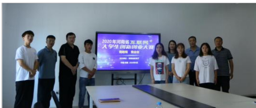
指导教师、学生团队合影

本次大赛是我院在大学生创新创业大赛中的新的探索和突破，所取得的优异成绩，是指导教师和团队成员进行创新创业研发实践的结果，是学院深化创新创业教育改革和推进专创融合的结果。我院将以此次大赛为契机，持续激发师生创新创业热情，加快培养创新创业人才，形成以赛促学、以赛促教、以赛促创的新局面，为推动学院高质量发展奠定坚实基础。【审核：詹晓娅】