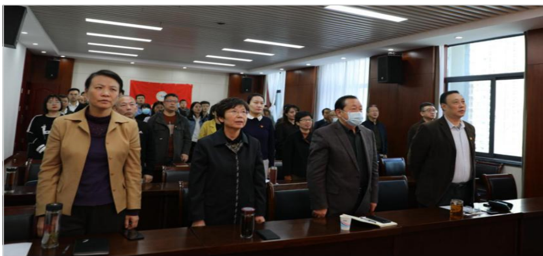
全体起立奏唱国歌

10月23日上午，纪念中国人民志愿军抗美援朝出国作战70周年大会在北京人民大会堂隆重举行。习近平总书记在会上发表重要讲话。我院组织广大师生观看大会直播，并产生热烈反响。大家热议习近平总书记的讲话，表示要铭记英雄先烈的丰功伟绩，弘扬伟大的抗美援朝精神，精诚团结，众志成城，凝聚磅礴力量，在实现中华民族伟大复兴的道路上书写新的篇章。