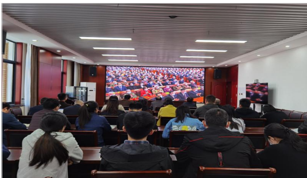
观看大会直播现场