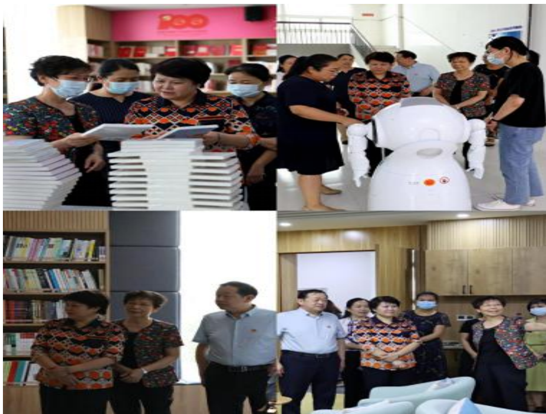
实地考察我院实习实训中心

随后，学院相关部门负责人、女职工代表就学院妇联成立以来的工作进行了汇报，并针对促进女性健康发展、创业就业等方面进行了交流。