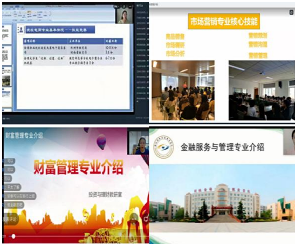
老师进行专业介绍